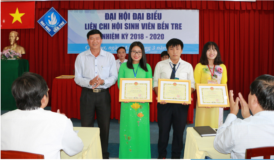
Các hội viên Liên chi hội sinh viên Bến Tre có nhiều thành tích nhận khen thưởng của lãnh đạo địa phương và Hội Sinh viên Trường ĐHCT.