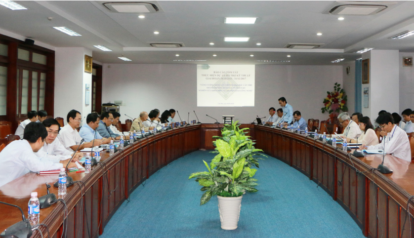
Toàn cảnh Hội thảo.