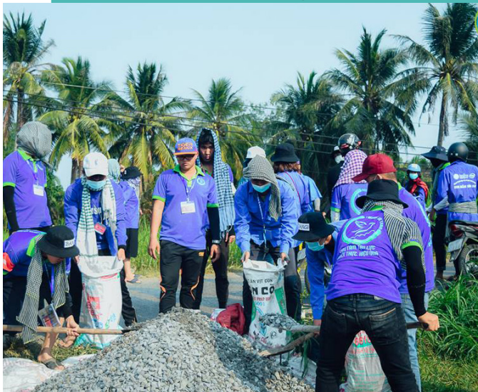
Hỗ trợ địa phương sửa chữa lộ giao thông.

Đặc biệt và ấn tượng nhất của chương trình năm nay là Ngày hội văn hóa Asean với bốn gian hàng được trang trí đậm nét văn hóa của