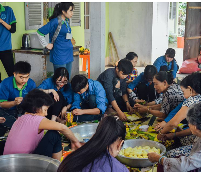
Các TNV cùng bà con địa phương gói bánh tét.

nghĩa lên bao; tham gia hái lộc xuân do các bạn TNV chuẩn bị hơn một tháng trước từ Ngày hội làm bao lì xì.