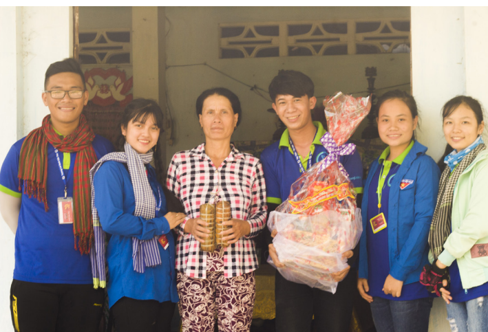
Trao quà cho những gia đình có hoàn cảnh khó khăn ở địa phương.

Nằm trong chuỗi các hoạt động của Chương trình Xuân yêu thương năm 2018, Ngày hội sắc màu tuổi thơ đã thu hút hơn 300 em học sinh bởi sự duyên dáng, trẻ trung của các bạn tình nguyện viên (TNV) khi hóa thân vào các nhân vật trong những câu chuyện cổ tích, rồi kể cho