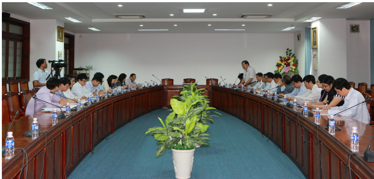
Toàn cảnh buổi làm việc.