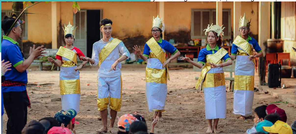
Các TNV thể hiện điệu múa truyền thống của đất nước Campuchia.

Tiếp nối những thành công của các năm trước, từ ngày 08/02/2018 đến ngày 11/02/2018, CLB Tương lai xanh đã tổ chức chương trình Xuân yêu thương năm 2018, tại Trường Tiểu học Bình