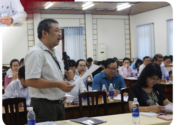
Đại biểu đóng góp ý kiến.

Chương trình đào tạo trình độ đại học ngành Truyền thông đa phương tiện được xây dựng với mục tiêu giúp cho người học: nắm vững các kiến thức nền tảng về mỹ thuật và công nghệ thông tin, kiến thức chuyên sâu và những kỹ năng về báo chí, truyền thông và quảng cáo; có khả năng triển khai các giải pháp và các sản phẩm truyền