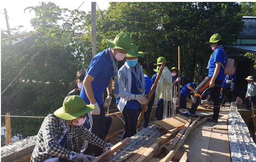
Ảnh minh họa.

Hành trình tuổi hai mươi của các bạn sinh viên từ trường học đến Mùa hè Xanh trên những miền quê thân yêu của đất nước với những hoạt động ý nghĩa như: đắp đê, xây cầu, phát hoang bụi rậm, tuyên truyền an toàn giao thông, phòng chống HIV/AIDS, dịch sốt xuất huyết... Dù ở bất kì nơi đâu, từ đồng bằng đến cao nguyên hay vùng biên giới, hải đảo xa xôi ta cũng bắt gặp màu áo thanh niên của lớp lớp thế hệ học sinh, sinh viên đang hăng hái học tập, tham gia các hoạt động vì lợi ích cộng đồng với tinh thần tự nguyện.